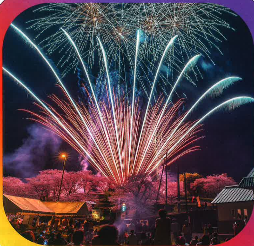
第3回 最優秀賞「桜花爛漫」上杉 孝徹

【募集テーマ】誰かにそっと伝えたいお気に入りの場所、あなたが発見した公園の魅力あふれる写真を募集します